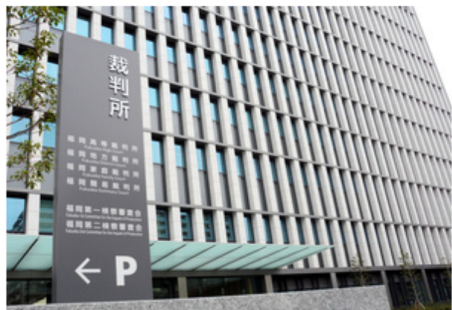
福岡地裁=福岡市中央区六本松4丁目